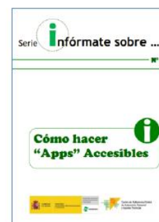
Cómo hacer apps accesibles