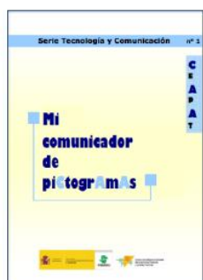
Mi comunicador de pictogramas

Está dentro de una serie titulada Tecnología y Comunicación, que os enlazamos completa: