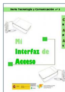
Mi interfaz de acceso