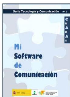
Mi software de comunicación