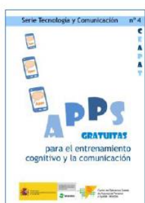
App gratuitas, versión completa